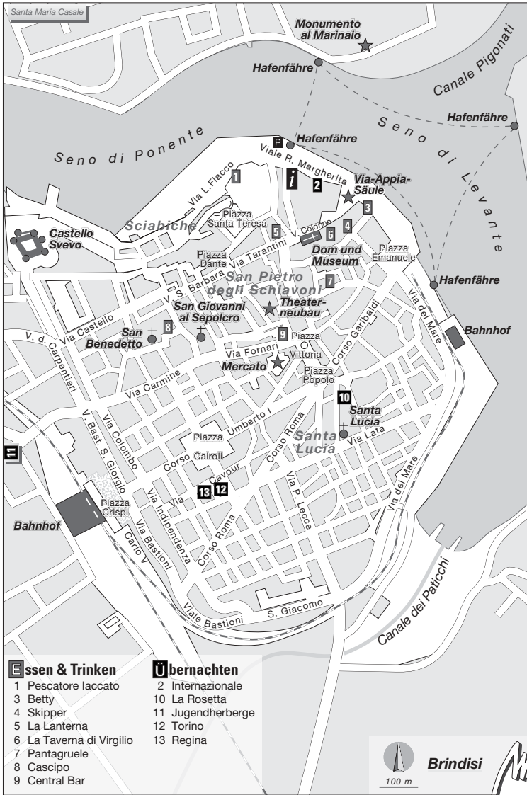
Provinz Brindisi Karte S. 281

Skipper (4). Via Dogana 2, Hafennähe, Querstraße zum Viale Regina Margherita; ideal für den Pizzahunger. Taverna di Virgilio (6). Via Colonne 3, Nähe Via-Appia-Säule, volkstümliche Trattoria