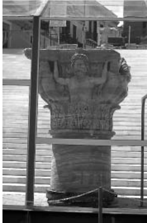
Das Kapitell der Appia-Säule stand zwischenzeitlich vor der Freitreppe am Hafen

Chiesa San Giovanni al Sepolcro: am Rande des Altstadtviertels San Pietro degli Schiavoni . Der kleine gedrungene Kirchenrundbau aus dem 11./12. Jh. gehörte zu den städtischen Besitztümern des Templerordens. Gesucht wird