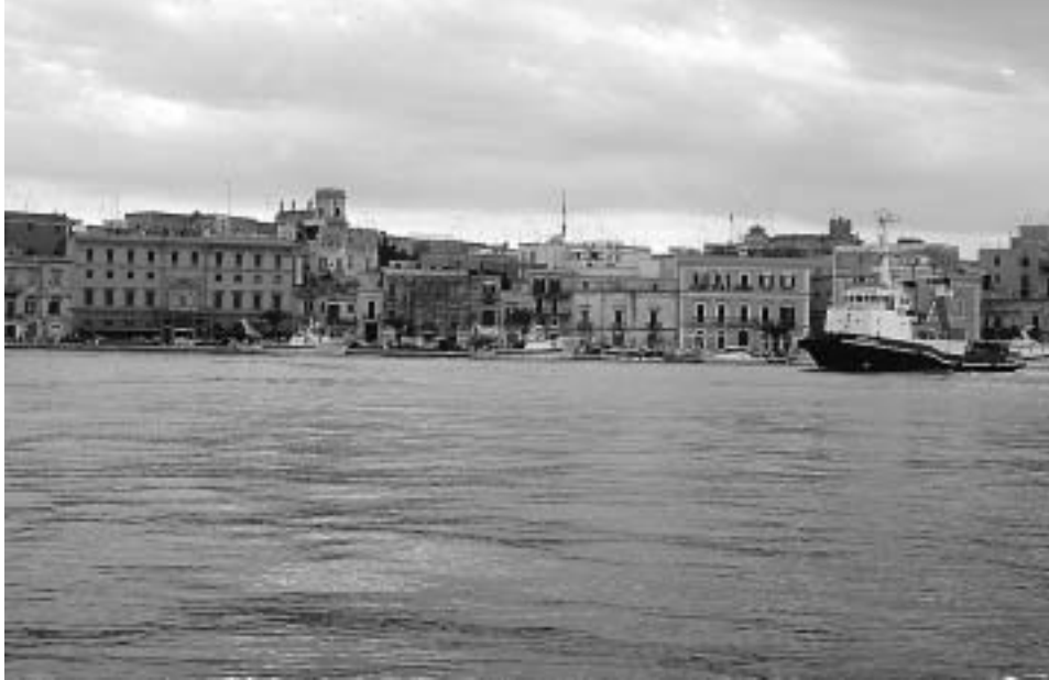
Brindisi – römisches Tor in den Orient