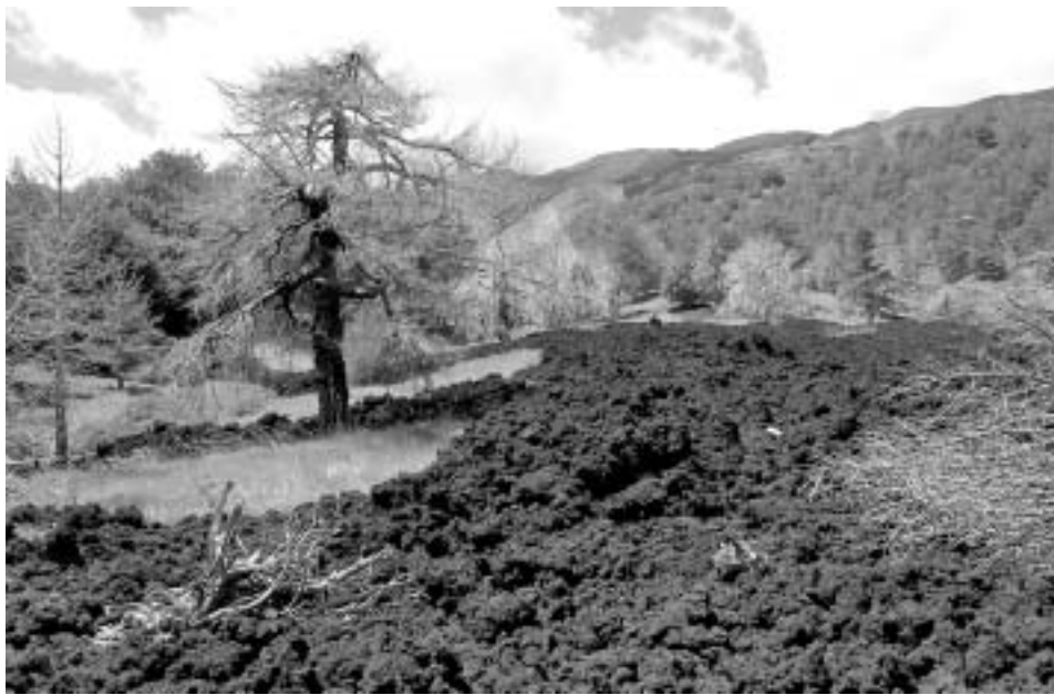
Zerstörerisch: Lavaström von 2002 bei Piano Provenzana