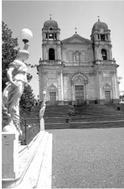
Noch einmal davongekommen: die Kirche von Zafferana Etnea

*** Hotel Primavera dell'Etna , das dem Ort am nächsten gelegene Hotel der Bergstraße. In mehreren Etagen ansteigender Komplex mit über 140 Betten, dank geschickter Architektur und hübscher Dekoration aber nicht unpersönlich. Mehrere begrünte Terrassen. Sehr gepflegte und saubere, wenn auch etwas hellhörige Zimmer, teils mit Etna-, teils mit Meerblick. Mit Disco und Tennisplatz; gutes und erstaunlich preiswertes Restaurant. DZ/F etwa 60–90 €.