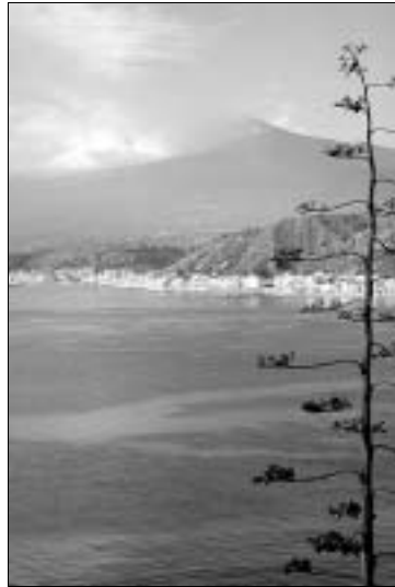
Der Etna von Giardini Naxos aus

Gefahren: Wer unbedingt auf einen Führer verzichten will und kein mit detaillierter Wanderkarte und sonstigen Utensilien versehener Bergprofi ist, sollte wenigstens die Fahrwege der Allradbusse nicht verlassen. In den Lavawüsten der Hänge verirrt man sich schnell, mehrere Menschen sind in den letzten Jahren spurlos verschwunden. Lassen Sie sich nicht von den sonnigen Temperaturen an der Küste täuschen – in den höheren Regionen ist auch im Sommer Nachtfrost keine Seltenheit, zudem sind schnelle Wetterumschwünge häufig. Etna-Touren sind keine Spaziergänge, ausreichende Verpflegung (Wasser!), warme Kleidung und entsprechendes Schuhwerk deshalb unverzichtbar. Asthma- oder Herzranke sollten auf Abstecher in die Höhenlagen verzichten, Kontaktlinsenträger (wegen des feinen Lavastaubs) besser eine Brille aufsetzen.