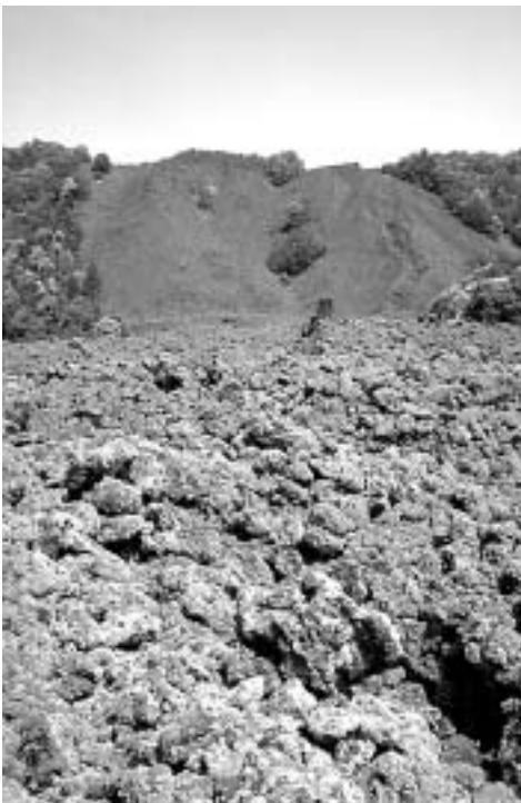
Eerstarrte Gewalten: junger Lavastrom bei Zafferana Etna

• Einkaufen Distillerie Fratelli Russo , ein Lesertipp von Evgeny Zlatkowsky: „Alt-ehrwürdige Grappa-Brennerei, auch Limoncello und sonstige Liköre sind zu haben. Fantastischer Grappa, unterschiedliche Sorten, mehrfach prämiert.“ In Dagala del Re, einem Ortsteil von Santa Venerina, Via Ducio Galimberti 70 (auf das Schild F.lli Russo achten), ☎ 095 953321, www.russo.it .